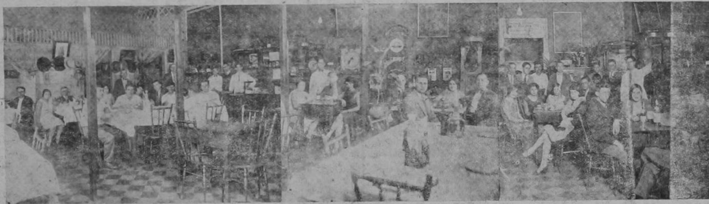
Salones de Servicio en que caballeros y señoritas saborean el exquisito Menú de este Hotel

CENAS A LA CARTA Abierto hasta 1 y 2 de la mañana